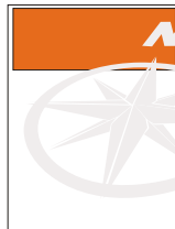
1/3 página horizontal