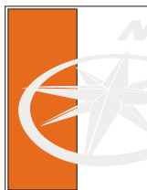
1/2 página vertical