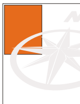
1/4 página horizontal