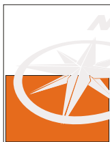
1/2 página horizontal