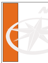
1/3 página vertical