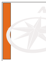
1/4 página vertical